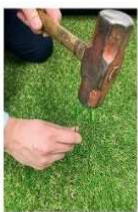
設置に便利なU字杭26本付き