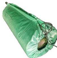
施工や保管などの取り回しに便利な ロール状でお届け