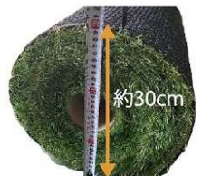
1巻ごと丁寧に手巻き