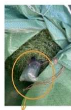
杭は中心紙管内へ収納