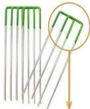
設置後に杭が目立ちにくいグリーン塗装